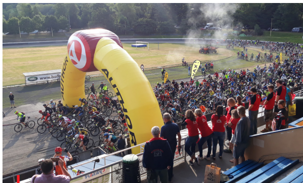
Kopřivnický drtič patří k nejpobulárnějším závodům horských kol.

Kromě vypsání programu během ledna KO ČUS Moravskoslezského kraje provedla už také sběr žádostí, jejich vyhodnocení, kontrolu a schválení výpočtu i příspěvků konečným žadatelům z řad sportovních klubů, tělovýchovných jednot, tělocvičných jednot, fotbalových a hokejových klubů. Jejich počet se opět navýšil na 505. individuální žádost o dotaci se bude zabývat Zastupitelstvo Moravskoslezského kraje v březnu. V případě schválení garantuje KO ČUS připsání příspěvků na bankovní účty všem žadatelům v březnu a dubnu 2021.