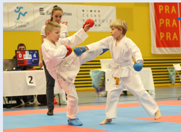
Na čtvrtém ročníku Kamizawa Cupu v Praze se představilo 250 mladých vyznavačů karate.

V průběhu turnaje se bojovníci podle věku a úrovně postupně představili v kategoriích techniky, kata a kumite, dále se sváděly souboje v chytání pásku, jehož cílem je chytit a odebrat protivníkovi jeho pásek. Nejoblíbenější soutěží - hlavně mezi nejmladšími účastníky - bylo karate agility, kde se účastníci v co nejkratším čase snažili zdolat trať plnou překážek a různých nástrah.