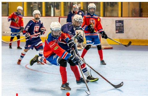
Sport chce od státu stejně prostředků jako kultura - třináct miliard korun

Stejně jako kultura, tedy třináct miliard. To je zcela legitimní požadavek. Je to dokonce v Konceptu podpory sportu do roku 2025, kterou schválila vláda. Vlády v minulosti schválily několik skvělých koncepcí, ale nikdo už o nich nic neví. Doufáme, že Andrej Babiš, který slíbil velké investice do sportu a reálně mu skutečně pomáhá, s tou zoufalou situací něco udělá. Činit se teď ale musí zejména ministr školství.