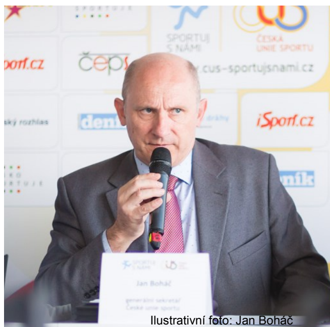
Ilustrativní foto: Jan Boháč

Rozpočet pro sport na příští rok by měl činit podle MŠMT 7 miliard korun, což je znatelné navýšení. Posílit by podle Karla Kováře mělo financování státní reprezentace a zejména talentované mládeže, zde se počítá až s 60% nárůstem. Jeho větší část se ale bude týkat zejména lyžování a kolektivních sportů. „Pokud