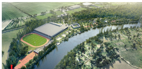
Jedna z možných podob SC Nymburk ze studia M4 architekti.

„Plán bude sloužit v rámci vyjednávání příštího rozpočtového období evropských peněz 2021-2027. Myslím, že jsme dobře připraveni a můžeme ukázat Evropě konkrétní projekty. Stěžejní je to, aby se projekty připravovaly. Ne že se bude čekat, až bude vyřešené celé financování. Ministr musí vědět, co má popohnat a začít chystat, i když ještě nemá peníze,“ komentoval význam národního investičního plánu premiér Andrej Babiš .